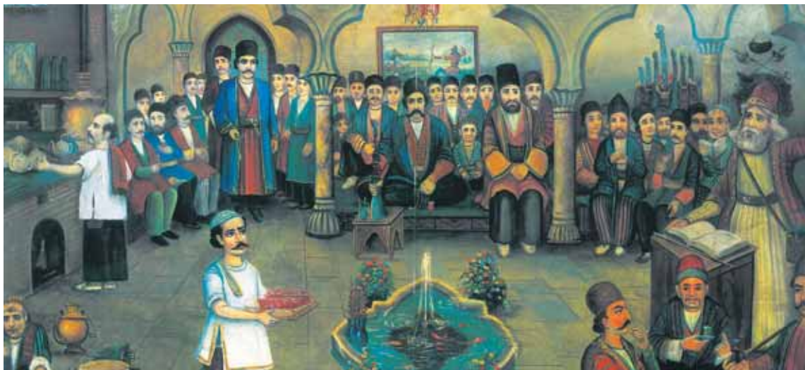
قهوه‌خانه قدیم - اثر حسن اسماعیل زاده